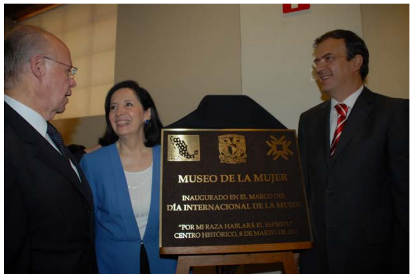
Dr. José Narro Robles, Dra. Patricia Galeana y Lic. Marcelo Ebrard

En el mes de diciembre de 2011, la federación celebró su XXIII Seminario Nacional Rompiendo el Techo de Cristal, en la Universidad Autónoma de Campeche. En este evento participaron 27 especialistas en temas de educación, ciencias e independencia financiera de las mujeres. En este seminario, se acordó promover la reforma al artículo 4º constitucional para establecer que toda persona tiene derechos sexuales y reproductivos; impulsar el amparo para las viudas de los trabajadores del ISSSTE, a quienes se les está quitando su pensión, en los casos que cuentan con algún ingreso; así como a las viudas de los soldados, a quienes se les prohíbe casarse, so amenaza de perder la pensión; así como reformar la ley de ciencia y tecnología, para que se incluya el enfoque de género.