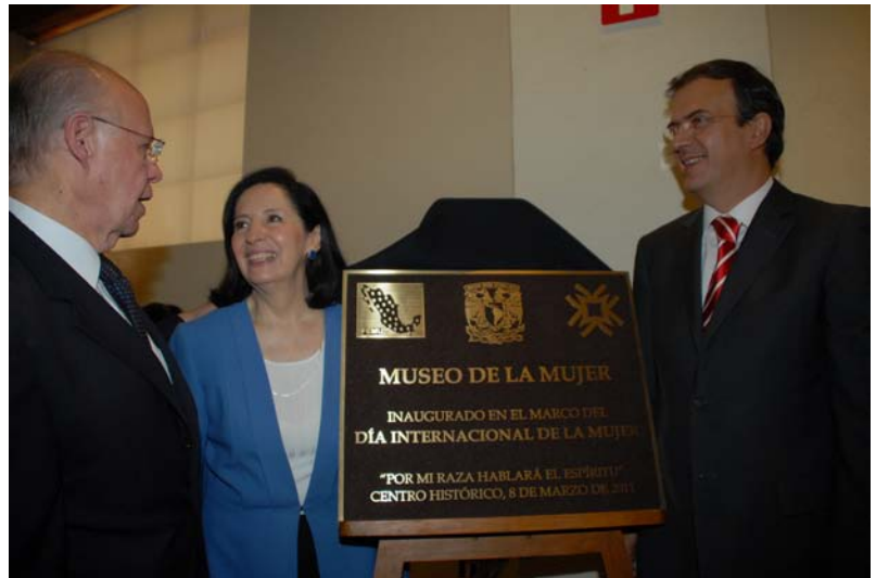
Dr. José Narro Robles, Dra. Patricia Galeana y Lic. Marcelo Ebrard

En el mes de diciembre de 2011, la federación celebró su XXIII Seminario Nacional Rompiendo el Techo de Cristal, en la Universidad Autónoma de Campeche. En este evento participaron 27 especialistas en temas de educación, ciencias e independencia financiera de las mujeres. En este seminario, se acordó promover la reforma al artículo 4º constitucional para establecer que toda persona tiene derechos sexuales y reproductivos; impulsar el amparo para las viudas de los trabajadores del ISSSTE, a quienes se les está quitando su pensión, en los casos que cuentan con algún ingreso; así como a las viudas de los soldados, a quienes se les prohíbe casarse, so amenaza de perder la pensión; así como reformar la ley de ciencia y tecnología, para que se incluya el enfoque de género.