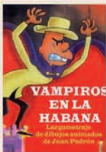
Vampiros en la Habana Juan Padrón Domingo 15