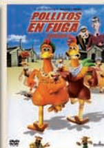
Pollitos en fuga Peter Lord Domingo 29

República de Bolivia #17, Centro Histórico, entre Brasil y Argentina. Colonia Centro. México D.F. 06020 5795-9596 y 5795-9425 Twitter: @museodelamujer Facebook: /museodelamujer www.museodelamujer.org.mx contacto@museodelamujer.org.mx