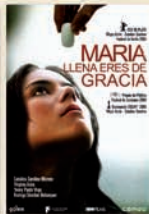
Maria llena eres de gracia Joshua Marston Martes 24