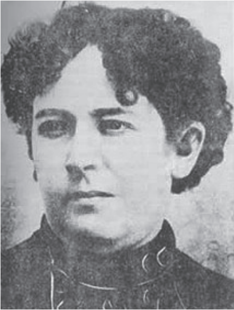
Dolores Jiménez y Muro

protección a los indígenas y la abolición de monopolios.