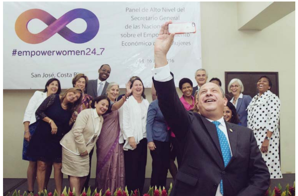
Integrantes del Alto Panel de Empoderamiento Económico de la Mujer, acompañados de Luis Guillermo Solís, presidente de Costa Rica

Subrayan que la igualdad de género es una cuestión de derechos humanos básicos, que potenciar económicamente a las mujeres puede generar grandes beneficios para el desarrollo humano, el crecimiento económico y de negocios. El informe sugiere siete ejes de acción para