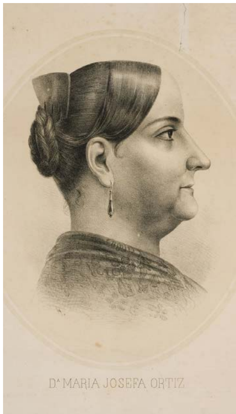
D a MARIA JOSEFA ORTIZ

Nació en la ciudad de Valladolid, hoy Morelia. Participó en las reuniones para planear la lucha insurgente que dio la independencia de España a nuestra nación. Logró avisar a Miguel Hidalgo, a Ignacio Allende y a