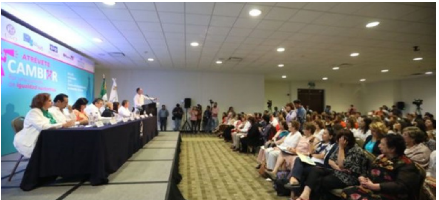
Ceremonia de inauguración del seminario “Atrévete a cambiar. Por una cultura de igualdad sustantiva”