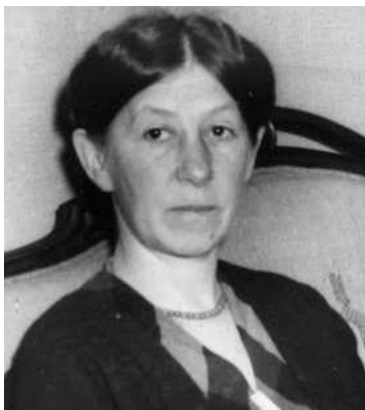
Ellen Gleditsch

Miembro de la Federación Internacional de Mujeres Universitarias (IFUW), fue vicepresidenta de 1924 a 1926 y presidenta de 1926 a 1929. En la conferencia de Kristiania (Oslo) en 1924, Gleditsch se asoció con la fundadora de GWI, Virginia Gildersleeve, para establecer el programa