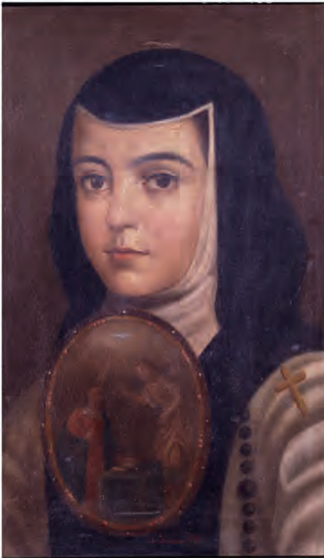
Sor Juana Inés de la Cruz

Juana Inés de Asbaje y Ramírez de Santillana nació el 12 de noviembre de 1651 en San Miguel de Nepantla, Amecameca. Se dedicó a la vida religiosa desde los dieciséis años, iniciándose con las Carmelitas Descalzas y profesó en el Convento de San Jerónimo. Dominó el latín y tuvo una cultura enciclopédica. Su producción literaria, tanto la poesía como prosa, alcanzó un nivel de excelencia. Sor