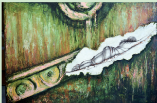
Obras pictóricas de Yvonne Limón