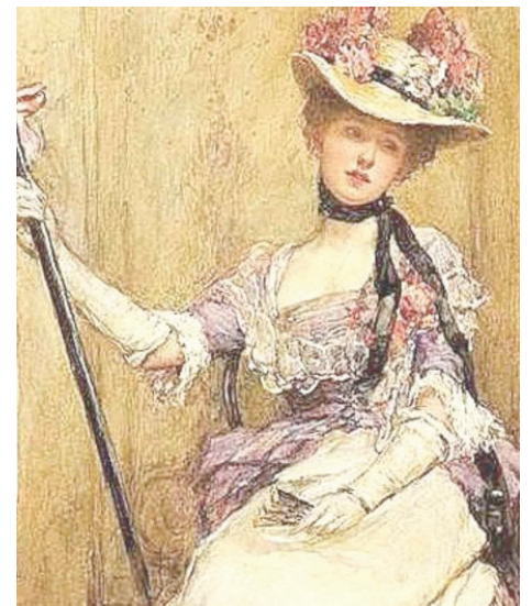
María Ignacia Rodríguez de Velasco y Osorio Barba

consideró la mujer más hermosa que había conocido en sus viajes. Fue amiga de Simón Bolívar y sirvió de modelo a Manuel Tolsá. Fue partidaria de Miguel Hidalgo y gran amiga de Agustín de Iturbide. Falleció el 1° de noviembre de 1850.