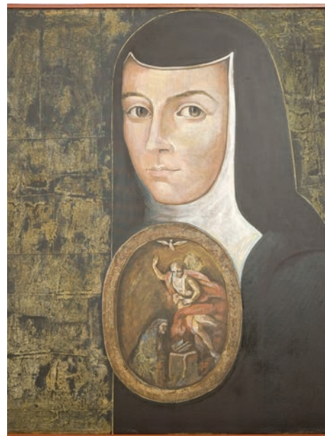
Sor Juana Inés de la Cruz

Juana Inés de Asbaje y Ramírez de Santillana nació en Nepantla, Amecameca. Se dedicó a la vida religiosa desde los 16 años, iniciando con las Carmelitas Descalzas y profesando en el Convento de San Gerónimo. Dominó el latín y tuvo una cultura enciclopédica.