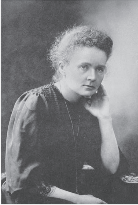
Marie Skłodowska Curie

de escuela secundaria. Recibió una educación general en las escuelas locales y formación científica de su padre. Se involucró en la organización revolucionaria de estudiantes. En 1891, se traslada a París para continuar sus estudios en la Sorbona, donde obtuvo la licenciatura en Física y Ciencias Matemáticas. En la Sorbona en 1894 conoció a Pierre Curie, profesor en la Escuela de Física y en el año siguiente se casaron.