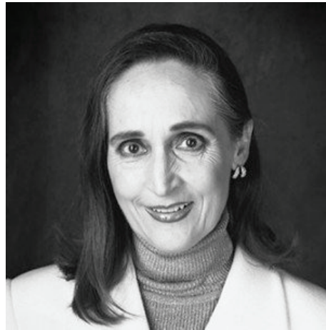
Gloria Contreras Röniger

la danza" otorgada por el Instituto Nacional de Bellas Artes en 1985 y en 1989. Falleció el 25 de noviembre de 2015.