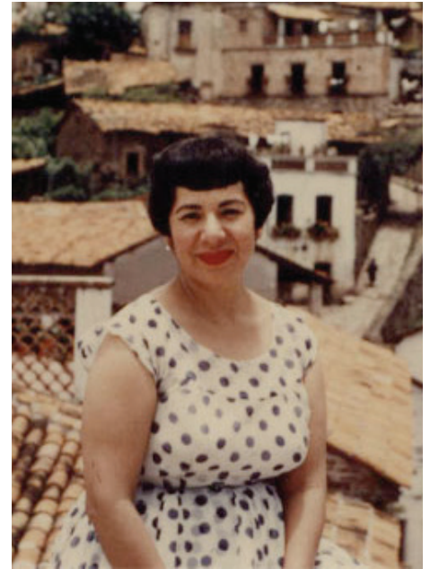
Clementina Díaz y de Ovando

En 1943 fue la primera mujer en ingresar como ayudante de investigador, al Instituto de Investigación Estética de la UNAM. En 1968 ocupó su dirección, siendo la primera mujer en encabezarlo.