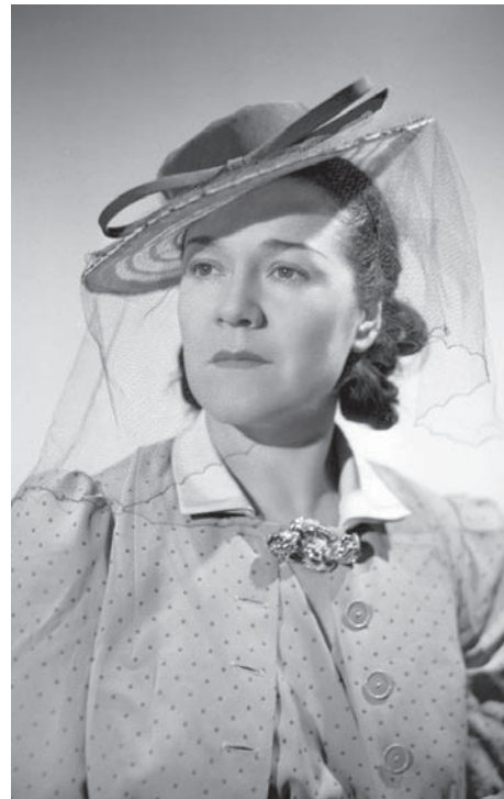
Nellie Francisca Campobello

Nellie Francisca Campobello nació en Durango, México. Destacada bailarina, coreógrafa, escritora y