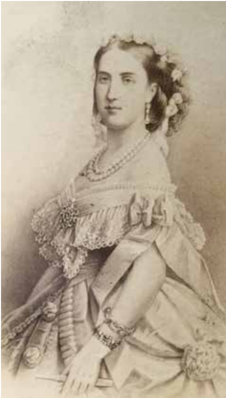
Carlota Emperatriz de México

por la Junta de Notables de México para ofrecerles el trono del país. El 12 de junio de 1864 llegaron a la capital de México y se instalaron en el castillo de Chapultepec. Carlota encabezó la regencia del Imperio mientras Maximiliano visitaba el interior del país.