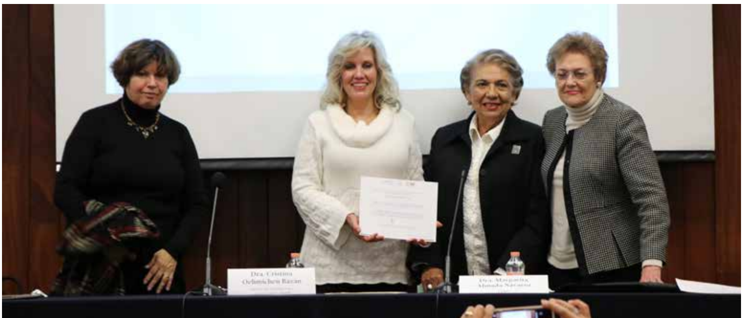
Entrega del reconocimiento a la FEMU por parte de la Delegación Federal Guerrero del Instituto Nacional de Migración de la Secretaría de Gobernación.