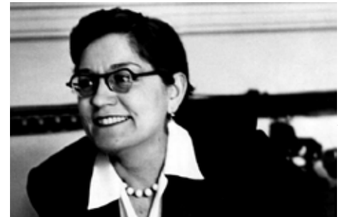
María Lavalle Urbina

de la mujer en el servicio público. Recibió el Premio de Derechos Humanos de la Organización de Naciones Unidas y la Medalla Belisario Domínguez. Sus restos descansan en la Rotonda de las Personas Ilustres. Murió en 1996 en la ciudad de México. Fue integrante honoraria del Consejo de la FEMU.