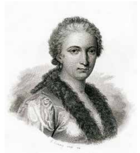
María Gaetana Agnes

Nació en Milán el 16 de mayo de 1718. Matemática, y filósofa, Maria Agnesi pasó a la historia por ser la primera mujer en haber escrito uno de los primeros libros didácticos de matemáticas.