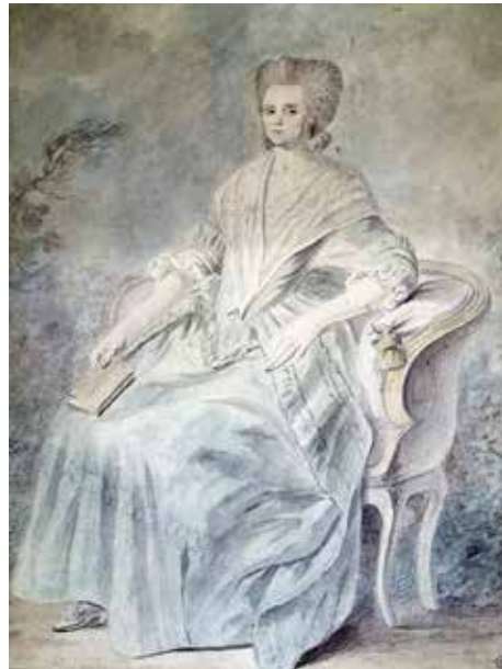
Olympe de Gouges

Marie Gouze nació en Montauban. Escritora e intelectual francesa que reivindicó la igualdad de derechos entre hombres y mujeres en el marco de la Revolución Francesa, considerada precursora del moderno feminismo. Autora de la célebre “Declaración de Derechos de la Mujer y de la Ciudadana”, texto dado a conocer en pleno auge de la Revolución Francesa en 1789. Por su beligerancia en criticar a los líderes de la Revolución y proclamar su insubmisión a las leyes que discriminaban a las mujeres, fue guillotinado en París en 1793, bajo la acusación de “traidora a la revolución”.