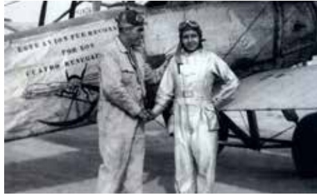
María Marcos Cedillo

El 05 de junio de 1933, María Marcos Cedillo perdió la vida en un accidente aéreo.