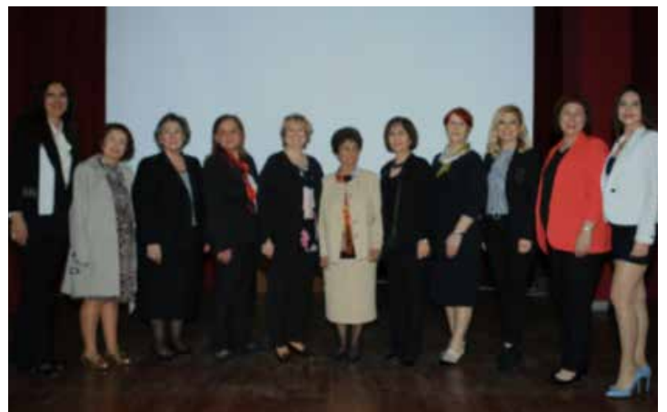
Integrantes de la Mesa Directiva de TAUW, ex presidentas y premiadas de la 12ª edición de los Premios a Mujeres Líderes de TAUW.

¡GWI felicita a todas las ganadoras de los 12os Premios de Mujeres Líderes de TAUW!