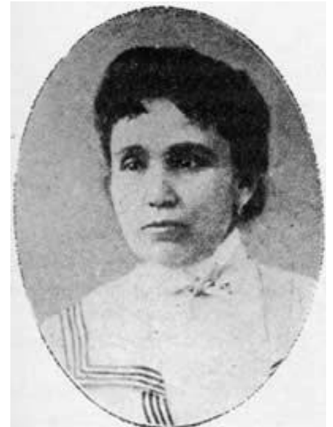
Dolores Jiménez y Muro

Al salir del encierro se unió a las fuerzas zapatistas, donde redactó el prólogo del Plan de Ayala. Dolores Jiménez y Muro murió en 1925 a los 75 años.