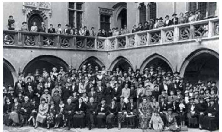
Mujeres universitarias de Gran Bretaña, Canadá y Estados Unidos se reunieron para sentar las bases de la Federación Internacional de Mujeres Universitarias (IFUW).

FEMU se enorgullece de pertenecer a esta red de mujeres que luchan por un mundo de igualdad y paz donde todas tengan acceso a la educación y contribuyan al desarrollo integral de los pueblos.