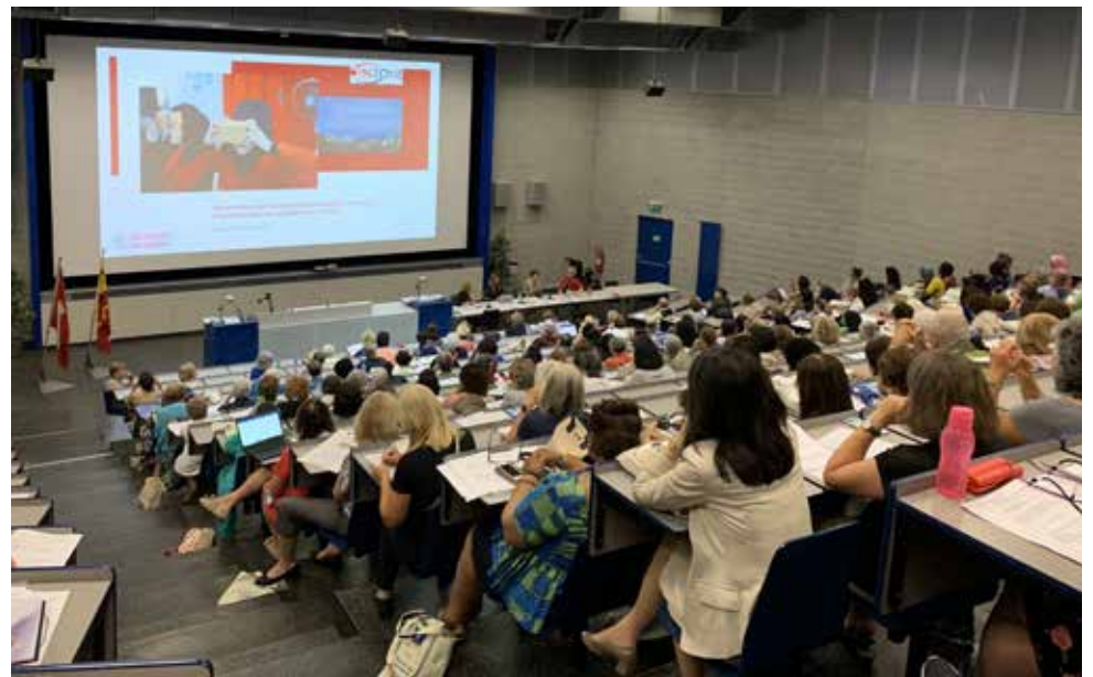
Sesión Plenaria de Votaciones del 33º Congreso de GWU

Se conformó el bloque norteamericano CAMEUS: Canadá, México y