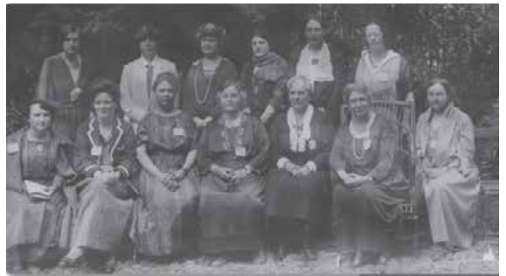
Consejo IFUW 1922

nal de Mujeres Universitarias, ahora Graduate Women International: https://graduatewomen.org/wp-content/uploads/2019/08/2019-IFUW-Pioneers-19.08.2019.pdf .