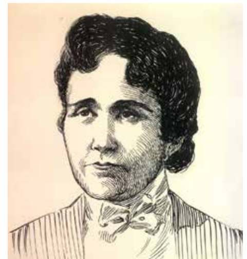
Dolores Jiménez y Muro

Redactó el Plan Político y Social Tacubaya en 1911. Fue aprendida durante el gobierno de León de la Barra. Al salir del encierro se unió a las fuerzas zapatistas, donde redactó el prólogo del Plan de Ayala, lo que le valió que Zapata la nombrara generala brigadier. Murió en 1925.