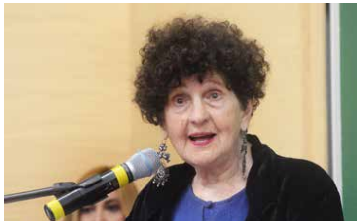
Premiada Margo Glantz

La Dra. Margo Glantz agradeció a la FEMU por este reconocimiento, que es muy significativo dada su entrañable amistad con Doña Clemen y reiteró su compromiso con la formación de las nuevas generaciones con una perspectiva de igualdad de género.