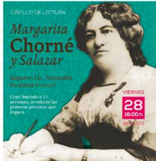
VIERNES 28 16:00 h GRATUITO

Cupo limitado a 15 personas, accederán las primeras personas que lleguen