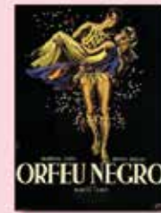
18 FEB Orfeo negro Dir. Marcel Carnus