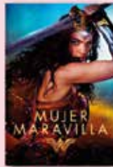
04 FEB La Mujer maravilla Dir. Patty Jenkins