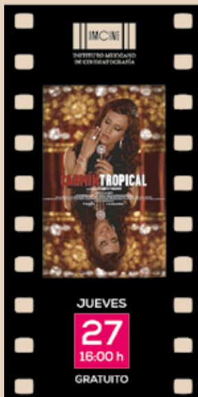
JUEVES 27 16:00 h GRATUITO CARMÍN TROPICAL Dir. Rigoberto Perezcano