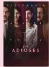
25 FEB Los adioses Dir. Natalia Beristáin