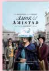
11 FEB Amor y amistad Dir. Whit Stillman