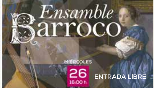
MIÉRCOLES 26 16:00 h