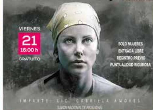
VIERNES 21 16:00 h GRATUITO

SOLO MUJERES ENTRADA LIBRE REGISTRO PREVIO PUNTUALIDAD RIGUROSA