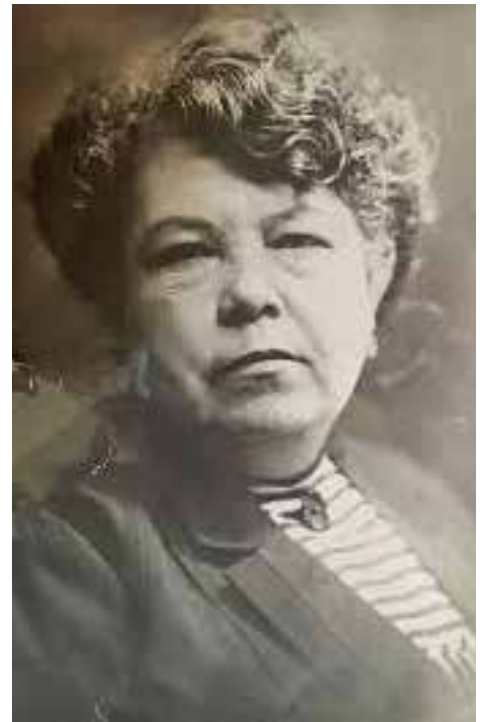
Matilde Petra Montoya Lafragua

• NATALICIO DE Matilde Petra Montoya Lafragua (1857-1938)