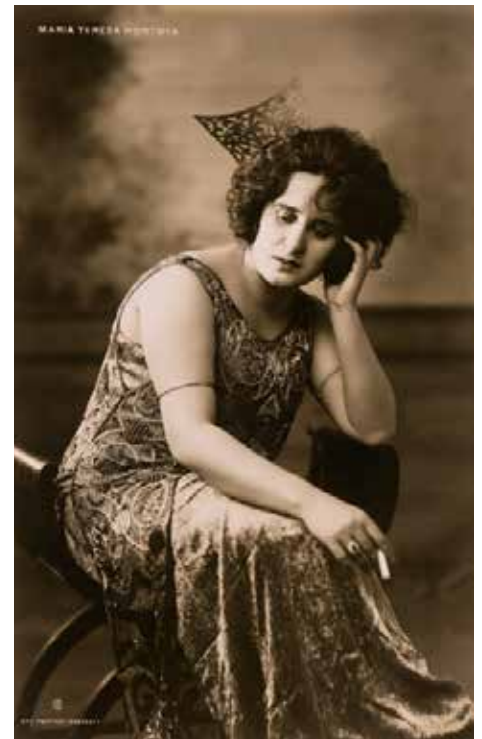
María Teresa Montoya

• CIUDAD DE MÉXICO. NATALICIO DE María Teresa Montoya (1900-1970)