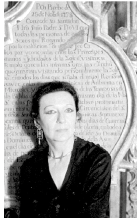
Olga Kostakosky Fabriant

Pintora y promotora de arte mejor conocida como Olga Costa. De origen alemán, emigró a México en 1925 y se dedicó a crear un arte mexicano que integraba la cultura popular. Fundó la Galería La Espiral en la ciudad de México, la cual dirigió por varios años y fue parte de la Sociedad para el impulso de las Artes Plásticas desde 1948. En