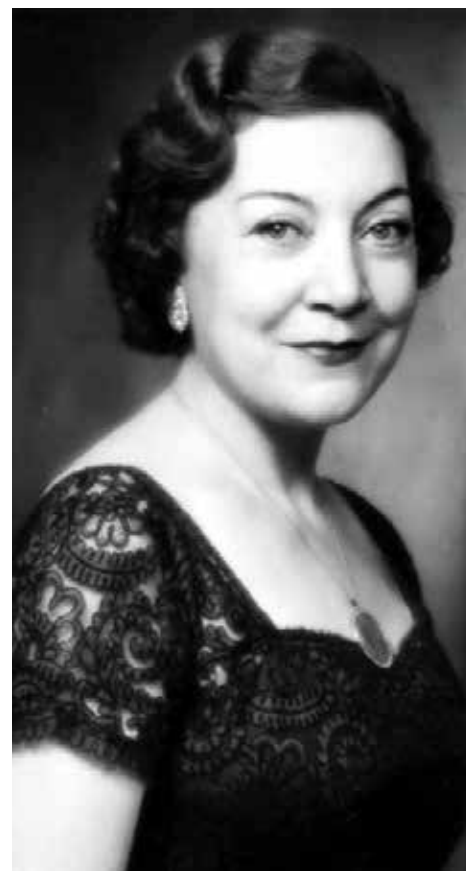
Amalia González Caballero

Nació el 18 de agosto de 1898 en Santander Jiménez, Tamaulipas. Fue una destacada sufragista. En 1934 se convirtió en la presidenta del Club Internacional de Mujeres. Fundó centros culturales para obreros en donde les enseñaban a leer y escribir a mujeres y hombres. En 1939, fue delegada de México ante la Comisión Interamericana de Mujeres. Luchó por la obtención de la ciudadanía plena a las mujeres. Creó la Alianza de Mujeres de México, y entregó a Ruiz Cortines la solicitud de voto federal con miles de firmas.