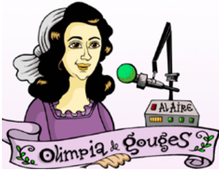
Olympe de Gouges, Cintia Bolio

Precursora del feminismo. Nació en Montauban, Francia. Dramaturga y luchadora social, autora de la célebre “Declaración de Derechos de la Mujer y de la Ciudadana”, en el marco de la Revolución Francesa en 1791. Exigió la igualdad de derechos entre el hombre y la mu-