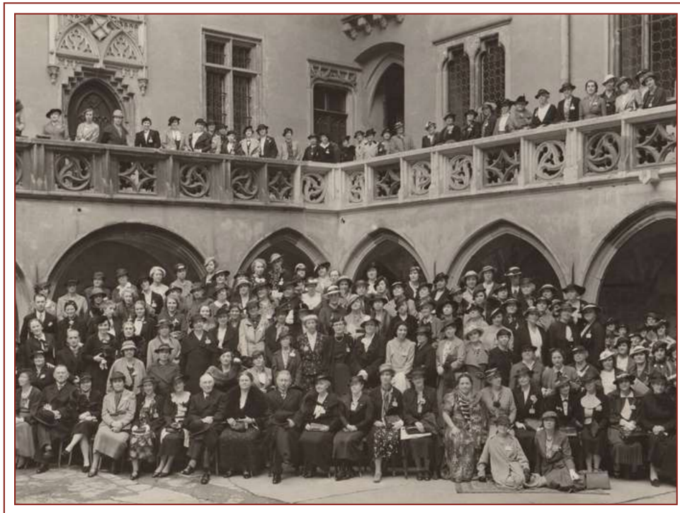
7th International Federation of University Women (IFUW) Conference- Crakow Poland, 1936