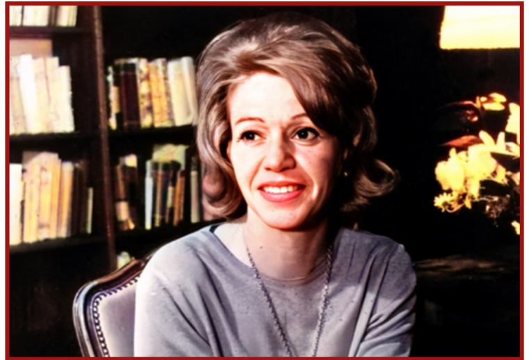
Elena Garro (1916-1998).

Nació el 11 de diciembre de 1916 en Puebla de Zaragoza. Escritora, periodista, dramaturga y coreógrafa. Destacó por su excepcional prosa plasmada en novelas, cuentos y obras de teatro, en las que también criticó la condición de la mujer, la desigualdad y la violencia machista. En el terreno periodístico, realizó entrevistas a personajes como Frida Kahlo y Pablo Neruda, e hizo reportajes en torno al reparto agrario y la condición de las mujeres presas. Fue defensora de los pueblos indígenas. Fue distinguida con los premios Xavier Villaurrutia por su novela Los recuerdos del porvenir (1963); y Sor Juana Inés de la Cruz (1996).