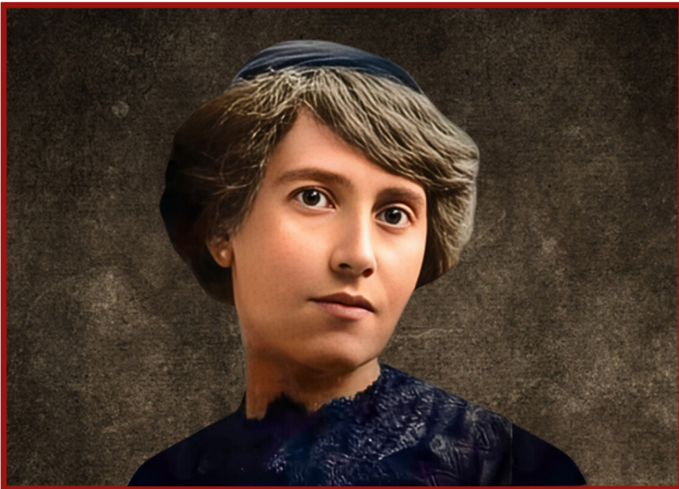
Carmen Serdán (1875-1948)

Nació en Puebla el 11 de noviembre de 1875. Revolucionaria, antirreeleccionista, maderista y constitucionalista. Fue encarcelada tras el asedio en su domicilio por las tropas federales. Fue periodista y también enfermera. Colaboró en “El Hijo del Ahuizote” y “El Diario del Hogar” bajo el seudónimo de Marcos Serratos. Murió en su ciudad natal.