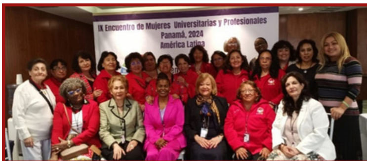
IX Encuentro de Mujeres Universitarias y Profesionales de América Latina

El X Encuentro se llevará a cabo en 2026 y tendrá como sede México, con la organización y anfitriónía de la FEMU.