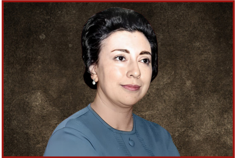
Rosario Castellanos (1925-1974)

Fue embajadora de México en Israel, donde falleció en 1974.