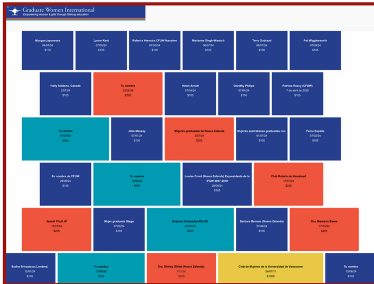
Muro virtual para la celebración del 105 aniversario de GWI

La GWI participó en el evento paralelo a la 56ª sesión del Consejo de Derechos Humanos (HRC56) "Cumbre del futuro: Compromiso de la sociedad civil con las Naciones Unidas". Se analizó la participación de la sociedad civil en los foros de la ONU y el papel de la sociedad civil en general en la defensa de los derechos humanos a nivel internacional. La GWI les invita a estar atentas a la actualización de la edición especial HRC56 para obtener una cobertura completa de la sesión.