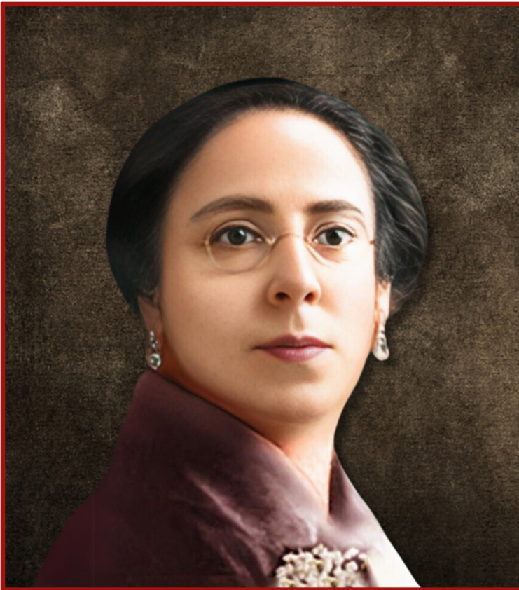
Hermila Galindo (1886-1954)

Nació el 2 de junio de 1886 en Durango. Fundó la revista Mujer Moderna en 1915, donde expuso la importancia de incorporar a las mujeres a las actividades públicas. En el Primer Congreso Feminista de Mérida en 1916 se leyó su ponencia: "La mujer del porvenir", que planteó la necesidad de educación sexual para las mujeres. Presentó al Congreso Constituyente de 1916 la iniciativa para otorgar la ciudadanía limitada a las mujeres, pero el sufragio femenino no fue incluido en la Carta Magna. Redactora de La Doctrina Carranza y la unión indolatina (1919). En 1920 recibió el primer nombramiento diplomático para una mujer, como Comisionada Cultural. En 1953 fue designada "La primera mujer congresista" en reconocimiento a su lucha por los derechos de las mujeres.