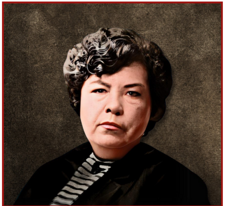
Matilde Montoya (1858-1938)

presentó su examen profesional en la Escuela Nacional de Medicina para obtener su título de partera, convirtiéndose en la primera mujer médica en el país.