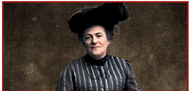
Clara Zetkin (1857-1933)

Durante la Primera Conferencia Internacional organizada por la Internacional Socialista de Mujeres. Originaria de Wiederau, Sajonia, formó parte del Partido Socialista de los Trabajadores, se afilió al Partido Socialdemócrata de Alemania y posteriormente al Partido Socialdemócrata Independiente alemán. Fue una de las fundadoras de la Internacional Socialista de Mujeres. Durante la segunda Conferencia Internacional de Mujeres Socialistas propuso la celebración del Día Internacional de la Mujer.