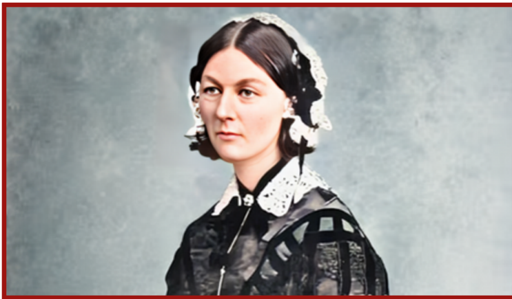
Florence Nightingale (1820-1910)

Nació el 12 de mayo de 1820 en Florencia, Italia. Se reconoce como la precursora de la profesionalización de la enfermería moderna; fue fundadora y cofundadora de docenas de hospitales y escuelas de enfermería en Inglaterra, Escocia, Canadá, Australia y los Estados Unidos. Su labor la hizo acreedora de innumerables condecoraciones, entre ellas las que le otorgó la Reina Victoria: la Cruz Roja Real y la Orden al Mérito. Publicó varios libros, destacan: Cassandra y Notas sobre la enfermería: lo que es y lo que no es . Como matemática estadística, inventó el "Diagrama Nightingale" o "Diagrama de área polar", y un histograma circular para registrar la mortalidad hospitalaria.