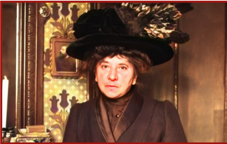
Hubertine Auclert (1848-1914)

En 1876 fundó la asociación Le Droit des femmes y en 1880, Le Suffrage des femmes . Defendió la reivindicación histórica de Juana de Arco y la propuso como un símbolo de la lucha feminista. Ejerció su activismo en defensa de los derechos de las mujeres hasta su muerte. Utilizó el término “Feminismo” para difundir la doctrina social que busca la igualdad de derechos de hombres y mujeres.