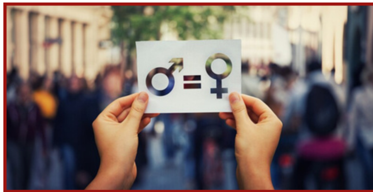
Ley general para la igualdad entre mujeres y hombres.

Establece los lineamientos y mecanismos institucionales para la igualdad sustantiva en los ámbitos público y privado, promoviendo el empoderamiento de las mujeres y la lucha contra toda discriminación basada en el sexo.