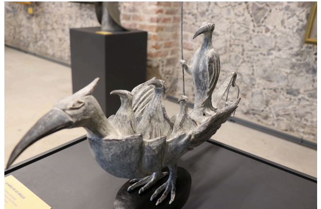
LEONORA CARRINGTON, LA BARCA DE LAS GRULLAS, COL. MUSEO DE LA MUJER

donde realizó la mayor parte de su obra. En 2005 recibió el Premio Nacional de Bellas Artes y fue nombrada Ciudadana de Honor de México. Visita en el Museo de la Mujer su obra.