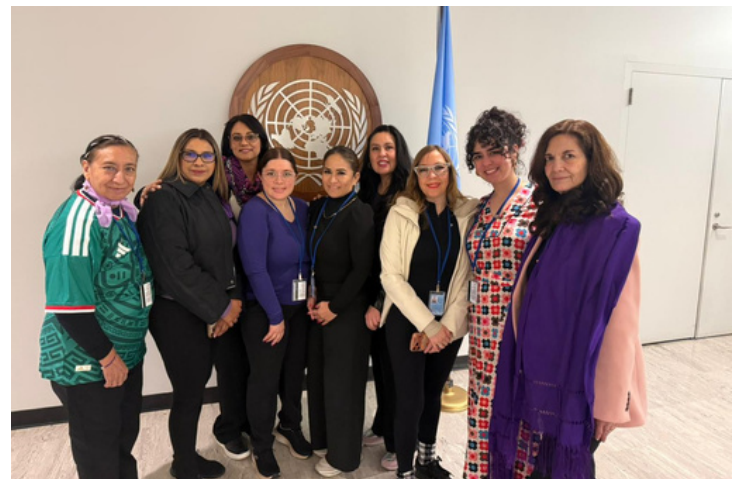
DELEGACIÓN DE LA FEMU EN LA CSW70, 9 DE MARZO DE 2026