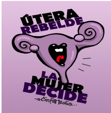
CINTIA BOLIO, ÚTERA REBELDE