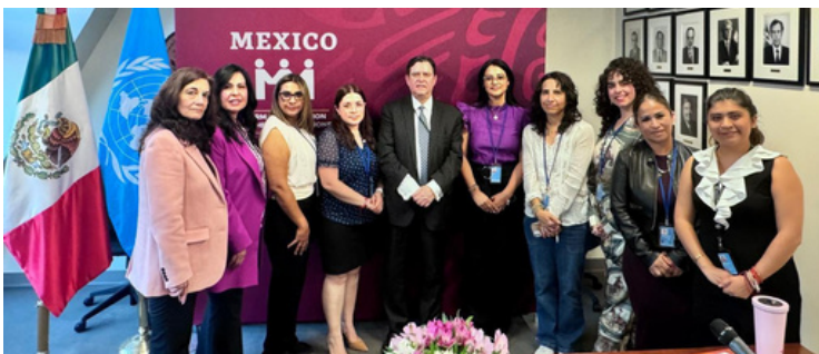
REUNION DE LA DELEGACIÓN DE FEMU CON EL EMBAJADOR ALTERNO ANTE LAS NACIONES UNIDAS, PORFIRIO THIERRY MUÑOZ LEDO, 11 MARZO DE 2026

Por la tarde la delegación presentó el informe ejecutivo de FEMU ante la Representación de México en la ONU, en cumplimiento de sus obligaciones como órgano consultivo del ECOSOC. Se sostuvo un diálogo productivo sobre los problemas del Estado mexicano relativos a los temas de la CSW70, con el embajador alterno, Porfirio Thierry Muñoz Ledo.