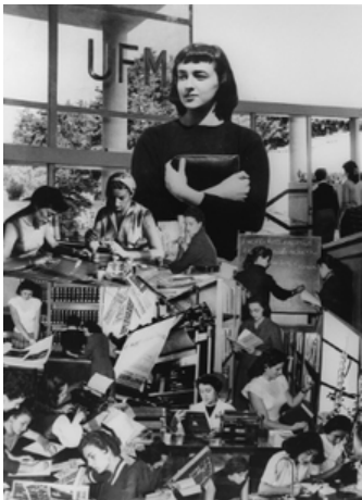
LOLA ÁLVAREZ BRAVO, UNIVERSIDAD FEMENINA, 1943, DE LA COLECCIÓN COLECCIÓN ABIERTA

Originaria de Lagos de Moreno, Jalisco. Dolores Martínez de Anda, mejor conocida como Lola Álvarez Bravo, se desempeñó como reportera gráfica, fotógrafa comercial y documental, retratista profesional y artista plástica. Su obra es apreciada como una “biografía visual” del ámbito artístico, urbano y rural de México en el siglo XX. Fue jefa del Departamento Fotográfico del Instituto Nacional de Bellas Artes y Literatura (INBAL), donde registró la obra de destacados pintores. Además trabajó para el Instituto de Investigaciones Estéticas de la UNAM.