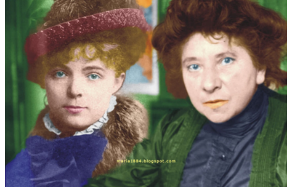
MARIE BASHKIRTSEFF, ARISTÓCRATA Y HUBERTINE AUCLERT, SOCIALISTA. JUNTAS POR EL FEMINISMO EN LA SOCIEDAD LE DROIT DES FEMMES. FOTOMONTAJE

Defendió la reivindicación histórica de Juana de Arco y la propuso como un símbolo de la lucha feminista. Ejerció su activismo en defensa de los derechos de las mujeres hasta su muerte.